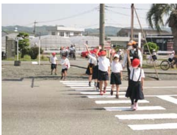
横断歩道の正しい通行方法