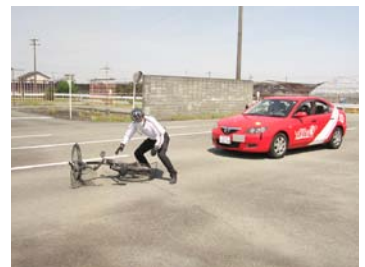
飛び出しの危険を実演