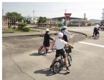
ルールに従った走行