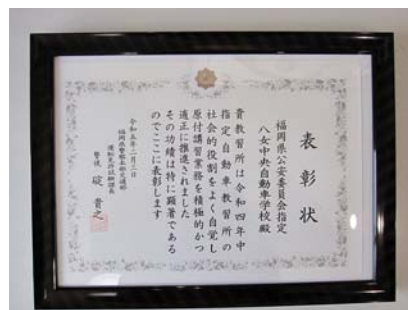
◎「原付講習業務表彰」

令和5年2月に令和4年中の「原付講習業務」、「交通安全教育活動」に対して運転免許試験課長より表彰状を受賞させて頂きました。原付講習業務については、日常の原付講習を適正に推進していることに対して警察本部から評価を得たものであり誠に光栄なものであります。