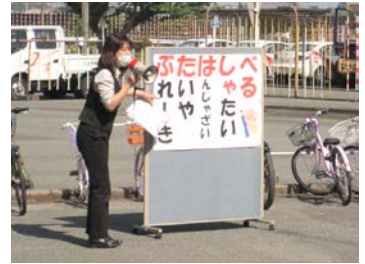
交通ルール等の説明