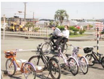
悪い乗車の一例 (二人乗り)