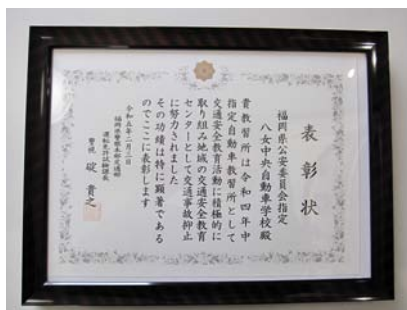
◎「交通安全教育活動表彰」