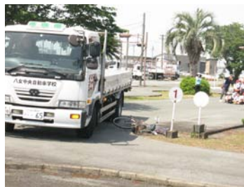
巻き込み事故の実演